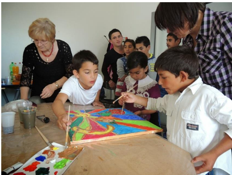
Na tvorivých dielňach v Tatranskej galérii v Poprade.

Projekt sme mohli realizovať s podporou Úradu vlády SR, z Programu Kultúra národnostných menšín. Projekt bol podporený sumou 2500,- EUR a s podporou Ministerstva vnútra SR, Okresný úrad Bratislava, odbor školstva – 950,- EUR.